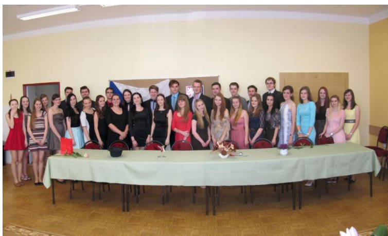
Třída 4.D při slavnostním ukončení MZ