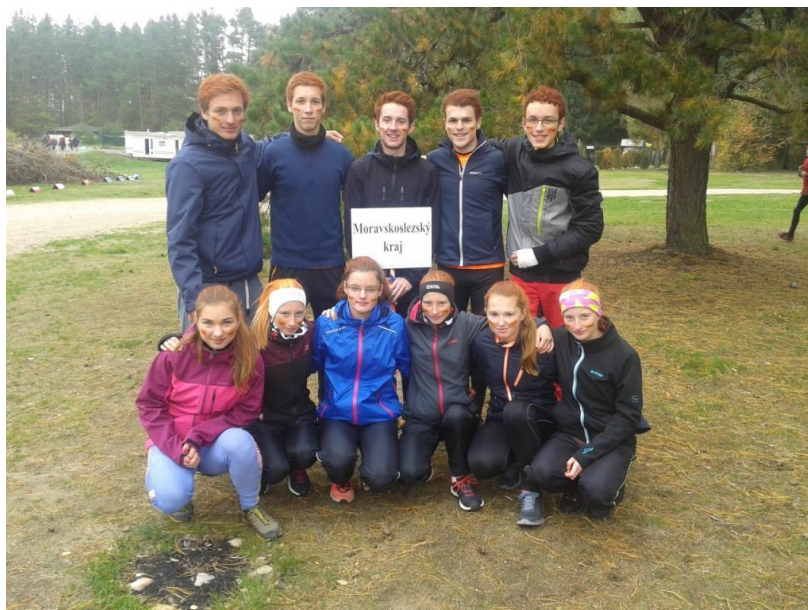
Z celostátního finále v přespolním běhu