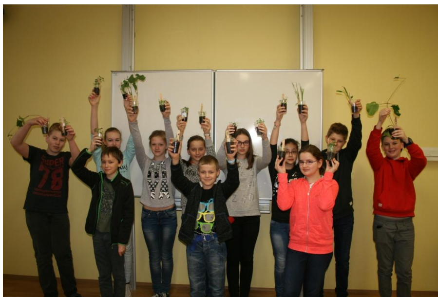
1.A se zapojila do soutěže časopisu R + R nazvané Growing plants