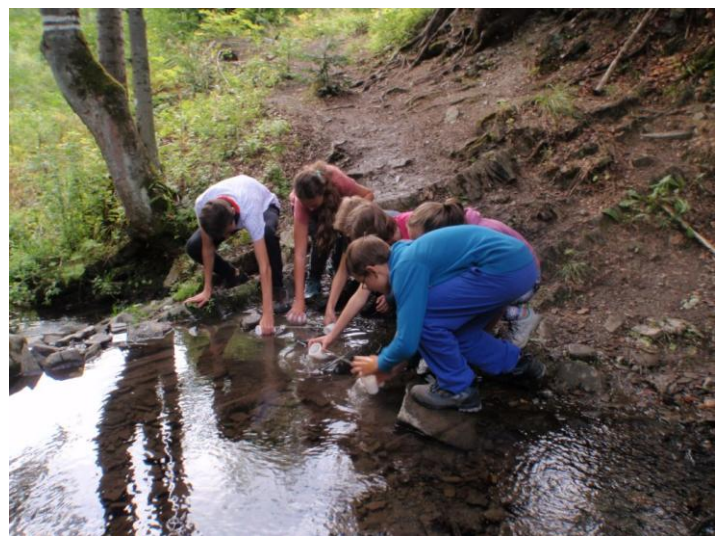
...a jeho realizace