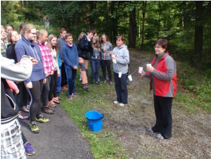
Vysvětlení úkolu účastníkům adaptačního kurzu...

Problematiku integrace žáků vyžadujících podpurná opatření škola individuálně konzultovala s pracovníci školských poradenských zařízení.