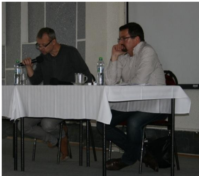
Úspěšní spisovatelé Martin Reiner a Michal Viewegh