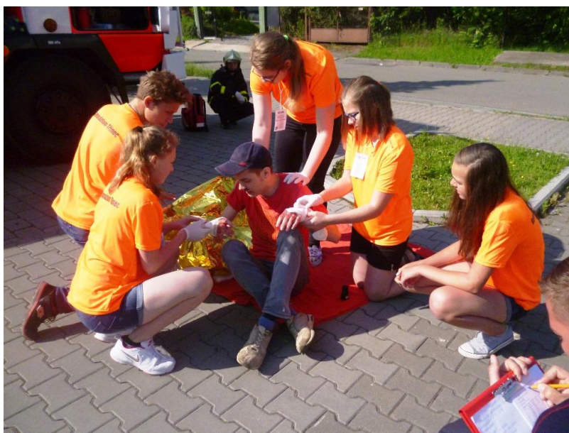
Družstvo 1.C v soutěži První pomoc – zachraň život