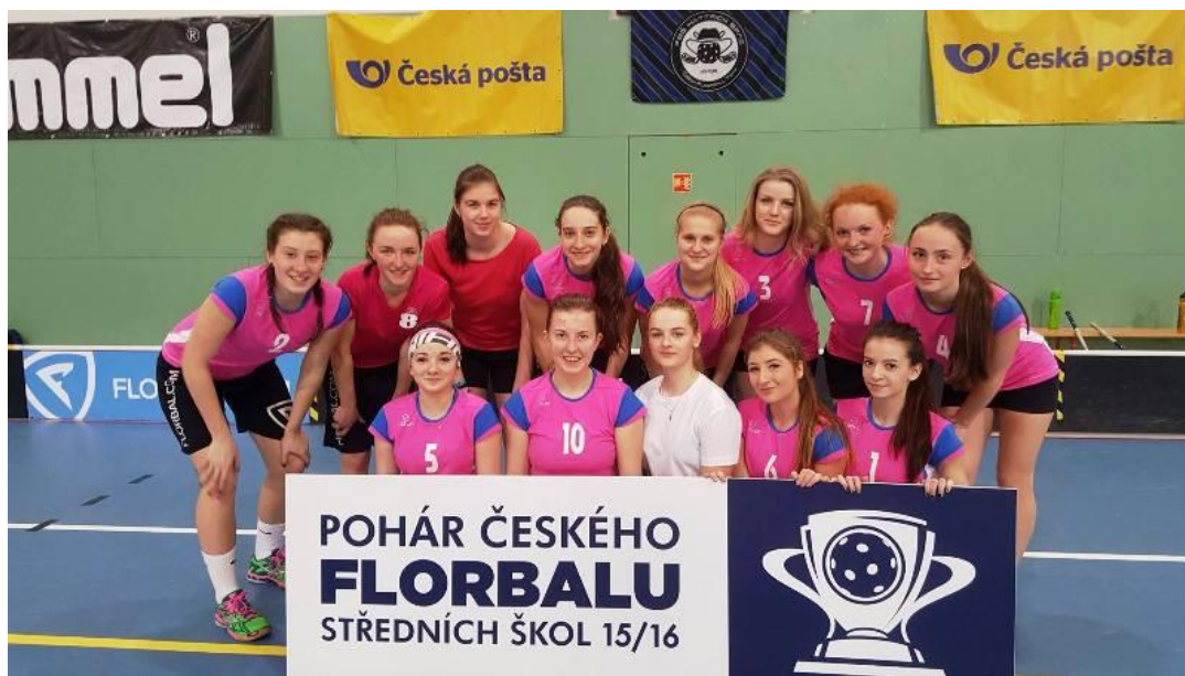
Úspěšné florbalistky bojovaly o pohár českého florbalu SŠ v Praze