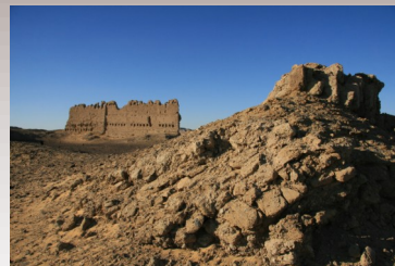
Téměř 2000 let staré střepy v poušti [almost 2000 years old fragments in desert]

Ve druhé části je pak zachyceno prolínání současné egyptské kultury s jejím životním prostředím a ve třetí naleznete několik málo snímků památek.