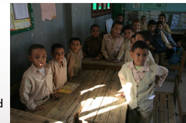
Škola v poušti [school in the desert]