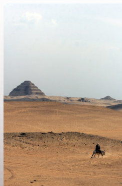
Džosérova pyramida [Djoser's pyramid]

[Exhibition consist of 34 big sized photographs printed on canvas. It is naturally divided into three parts, which are blending even so together up to certain extent. In first part is the main topic desert and its different appearances. In the second part is caught mixing of contemporary Egyptian culture with its environment and in the third part You will find few pictures of sights.]