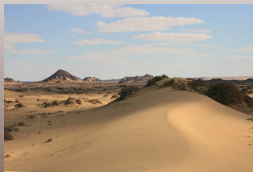
Písečná duna u oázy Bahariya [sand dune near Bahariya oasis]

[If I should describe in one word connection among displayed photos, it would be “impression”. That is why you can see in this exhibition pictures of desert plant with long sandy troughs created by wind, 1900 years old fragments left in the middle of desert by first Christians or cats lying on the mound of rubbish in Luxor. This all is simply Egypt. Understandably I could not avoid even classic “cliché” topics - Egyptian sights.]