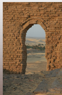
Ruiny Římské pevnosti [ruins of the roman fort]

[Exhibition consist of 34 big sized photographs printed on canvas. It is naturally divided into three parts, which are blending even so together up to certain extent. In first part is the main topic desert and its different appearances. In the second part is caught mixing of contemporary Egyptian culture with its environment and in the third part You will find few pictures of sights.]