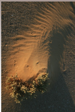
Pouštní květy [desert blossoms]